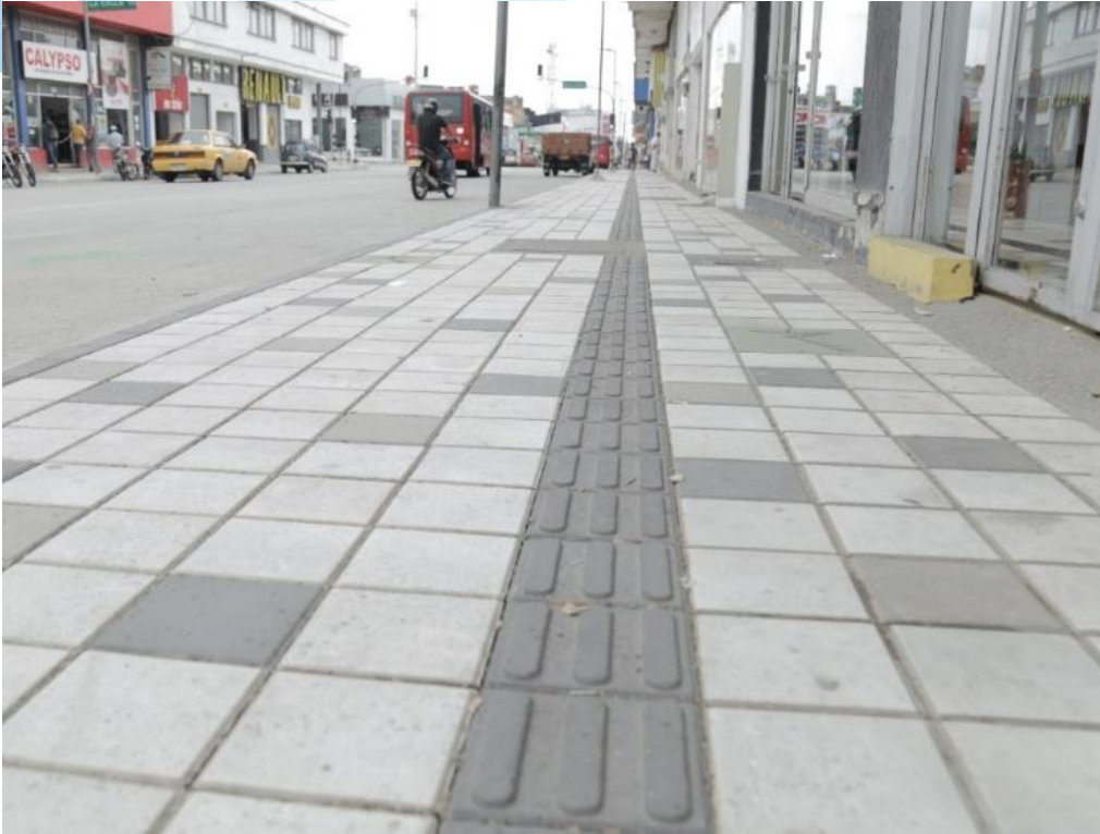
Rehabilitación vial Carrera 19 centro y renovación de andenes tramo 6