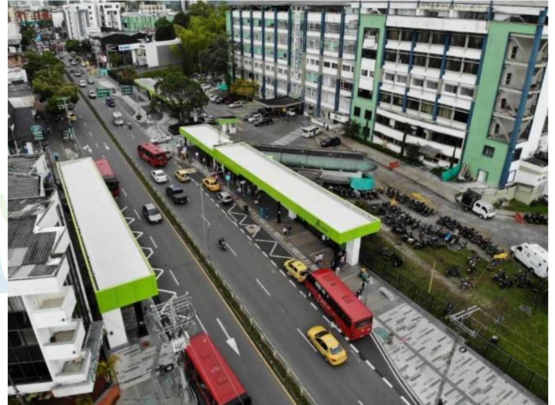
Paradero con Espacio Público PEP Hospital San Juan de Dios