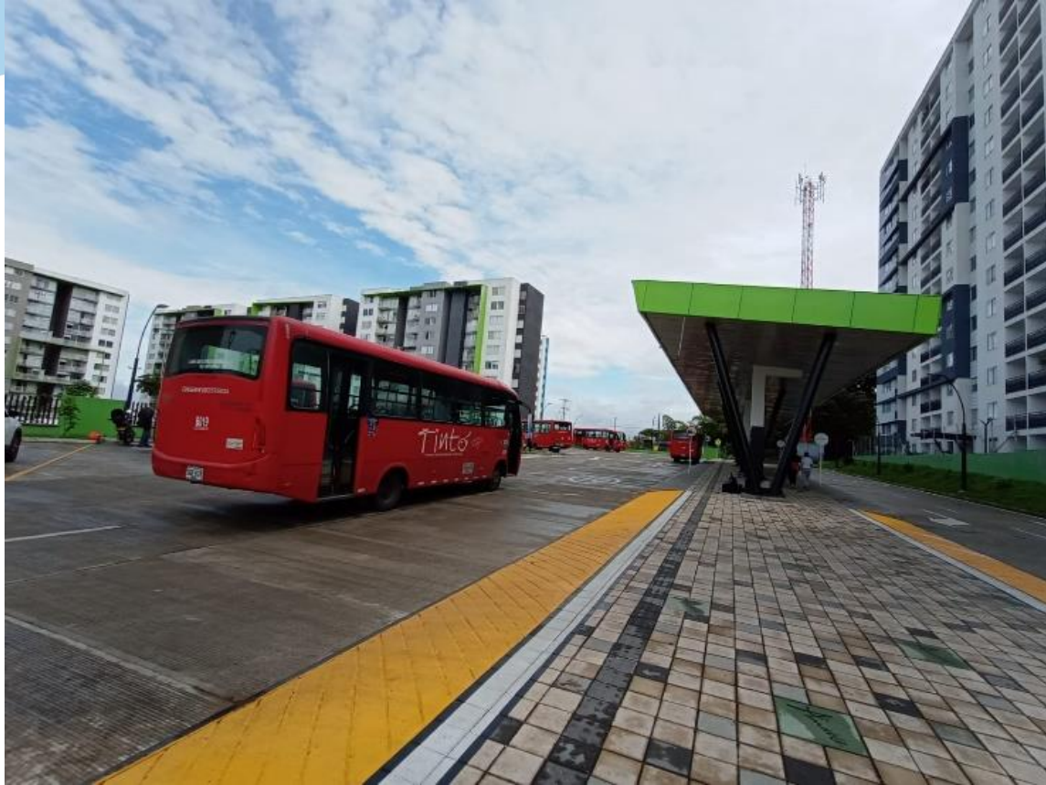
Terminal de Ruta Puerto Espejo