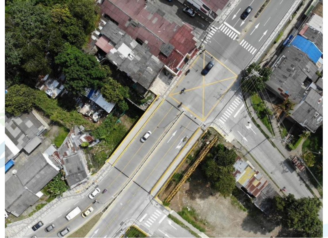
Proyecto vial Calle 50 tramo III (Puente los Quindos)